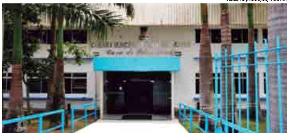
Sede do Legislativo municipal de Campina Grande, casa Félix Araújo, que só voltará a funcionar em março