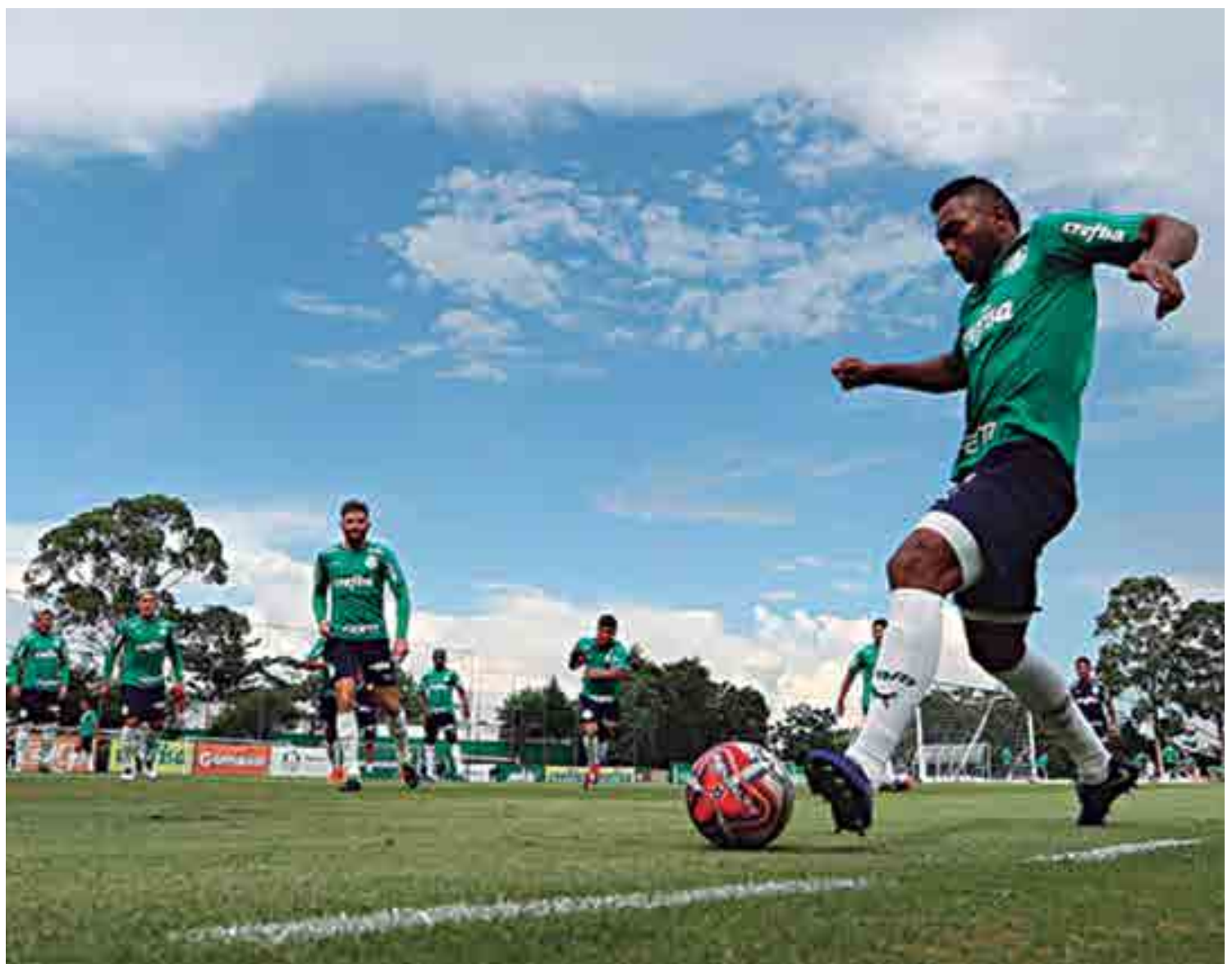
O Palmeiras voltou a treinar na manhã de ontem se preparando para o jogo de domingo contra a Ferroviária. Ricardo Goulart pode ser relacionado

O time de colete vermelho tinha Marcos Rocha, Luan, Edu Dracena, Diogo Barbosa, Thiago Santos, Moisés, Lucas Lima, Gustavo Scarpa e