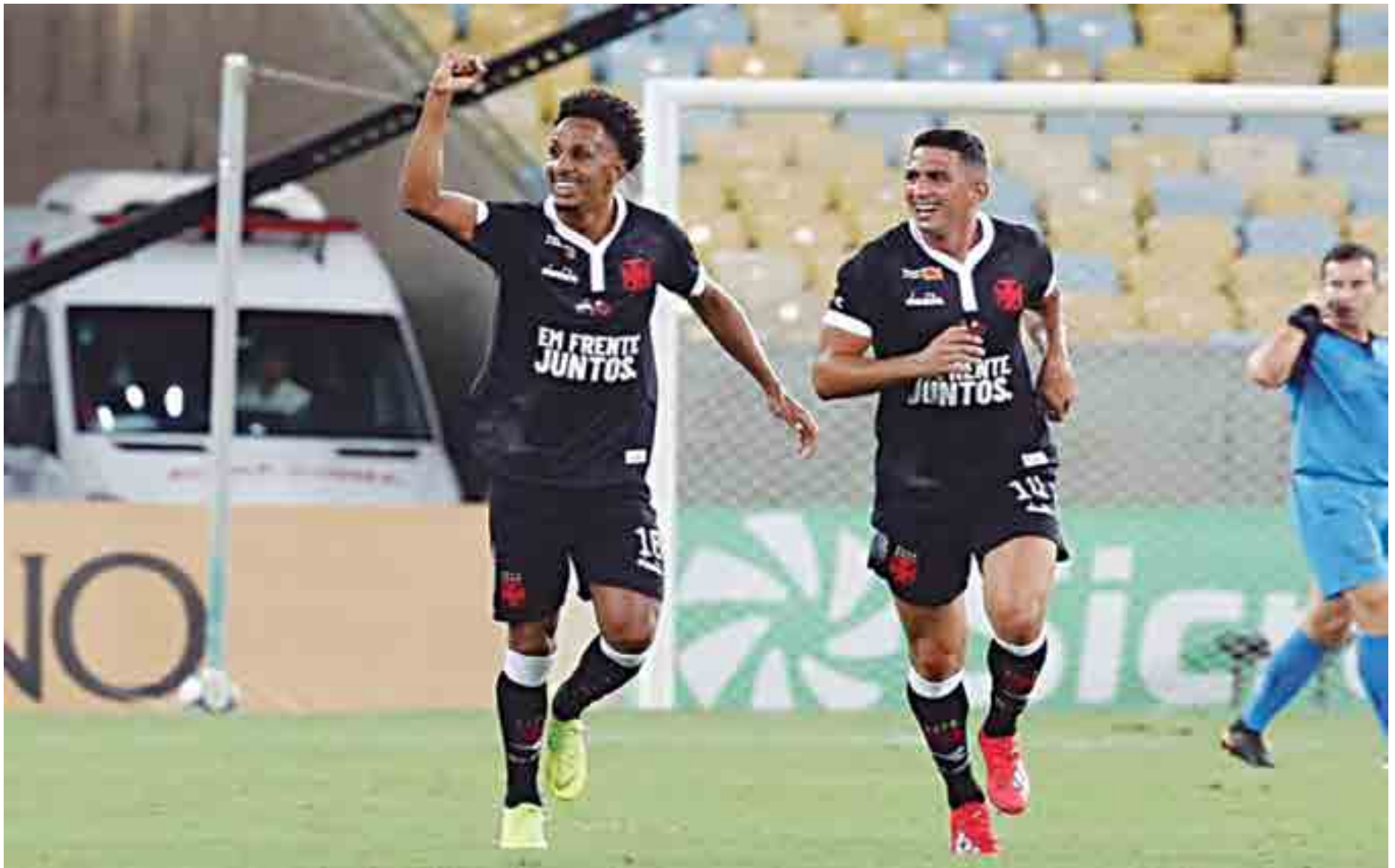
Na camisa do Vasco, no jogo contra o Resende, tinha as bandeiras do clube e a do Flamengo, num tributo aos garotos mortos no CT do Ninho do Urubu. A oposição condenou a atitude vascaína