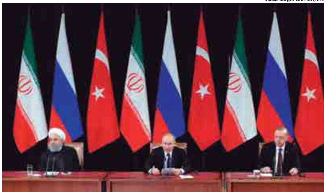
Hassan Rohan, Vladimir Putin e Recep Tayyip Erdogan se reuniram em Sochi, na Rússia, para discutir o conflito sírio

Mas a HTS, desde então, se fortaleceu e controla "mais de 90% do território do enclave", segundo o ministro das Relações Exteriores da Rússia, Sergei Lavrov.