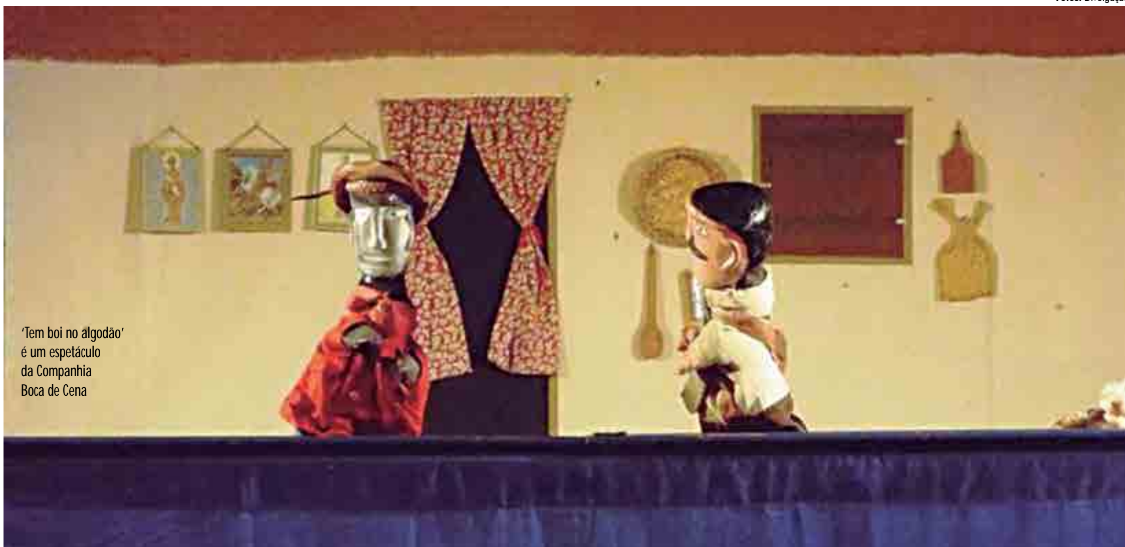
'Tem boi no algodão' é um espetáculo da Companhia Boca de Cena