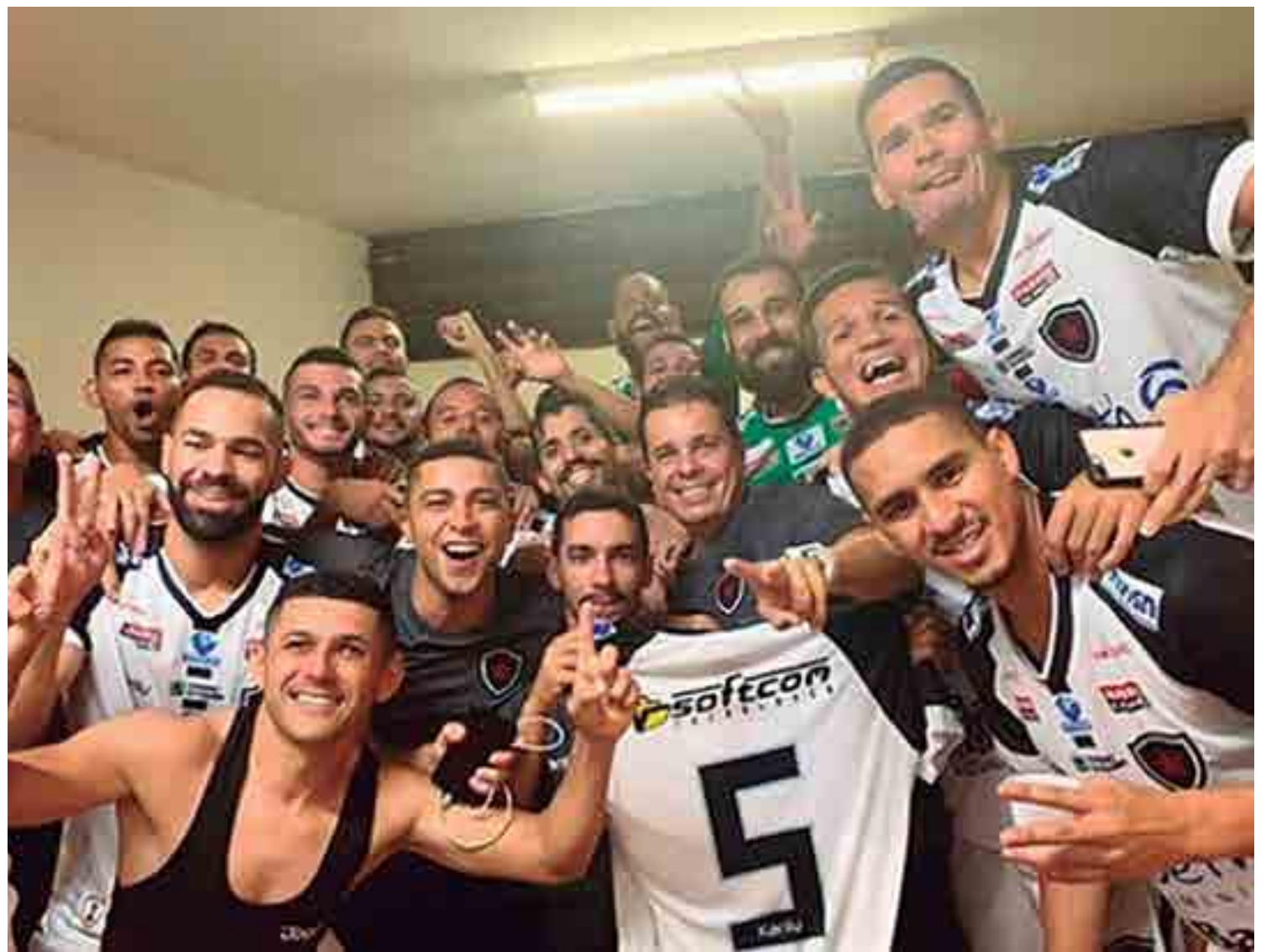
Jogadores do Botafogo já no vestiário comemorando mais uma grande vitória, agora na Copa do Brasil, quando goleou o Operário-MS por 4 a 1

Para esta partida contra o Treze, Marcos Nascimento poderá ter um reforço de peso. Trata-se de um atacante, com passagens pelo Botafogo e pelo Nacional de Patos, que pode fechar com o clube a qualquer momento, e ser registrado no BID, ainda hoje, para ter condições de jogo, já a partir de domingo. Hoje é o último dia para registro de jogadores no Campeonato Paraibano.