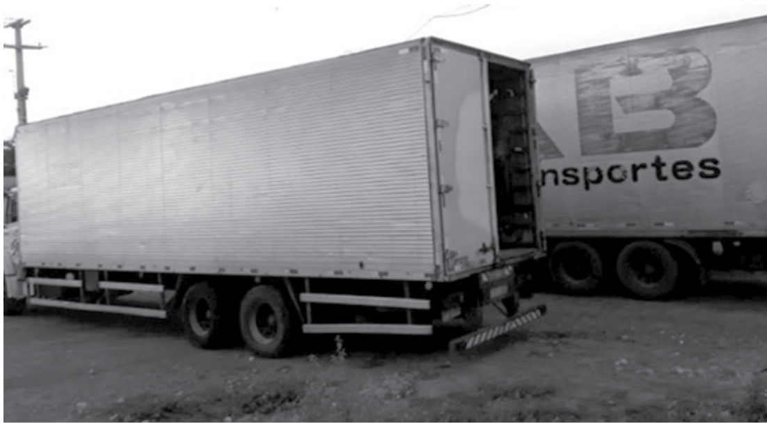
Primeiro veículo apreendido na BR-412 transportava mais de 26 mil unidades de vassouras, avaliadas em R$ 211 mil

Na mesma operação do Comando Fiscal de Campina Grande, auditores apreenderam outra carga irregular, desta vez de peças de motocicletas em um caminhão baú, cujas notas fiscais já estavam em território paraíba-