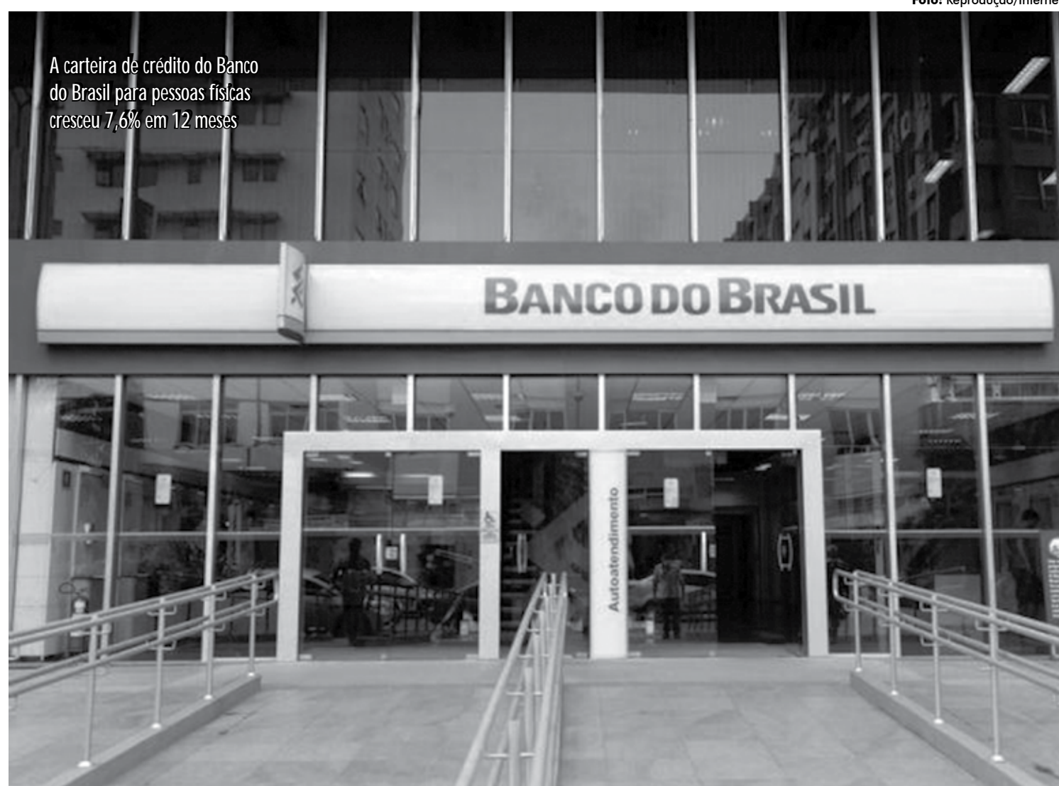
A carteira de crédito do Banco do Brasil para pessoas físicas cresceu 7,6% em 12 meses

A Enel Goiás atende 3 milhões de unidades consumidoras em 237 municípios do estado. A distribuidora faz parte do grupo de concessões alcançadas pelo Plano de Resultados da