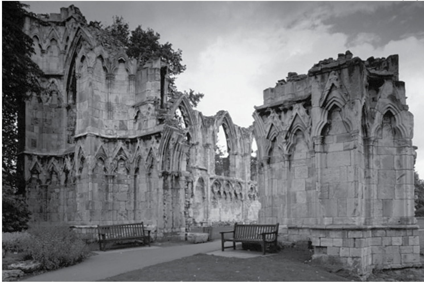
Ruínas do convento na Inglaterra onde teria vivido a freira que encenou a própria morte para poder desfrutar de uma vida de “luxúria carnal”