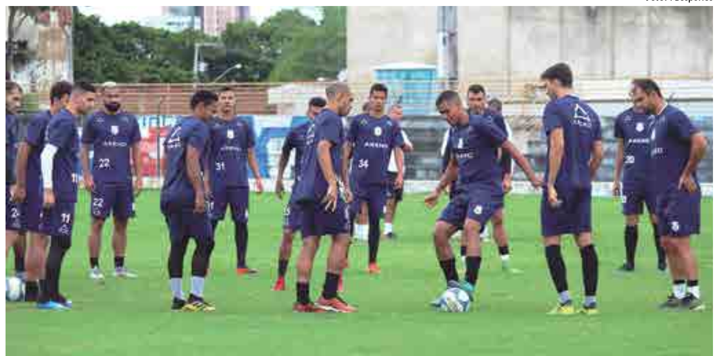
Jogadores do Treze treinando no Presidente Vargas ansiosos pelo início da segunda fase do Estadual quando esperam classificação à 2ª fase